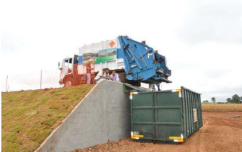
Foto 4 - Transbordo de Resíduos feitos a céu aberto para conteneir.