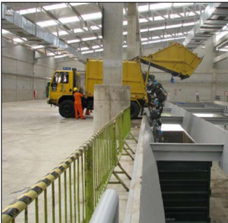
Foto 5 - Estação de transbordo – realizada direto no veículo transportador.