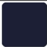
PANTONE® Evening Blue 19-3815