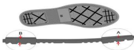
Vista do solado com desenho antiderrapante com o número gravado (Foto Ilustrativa)

SOLA – Peça integrante da base inferior do calçado. Deverá ser fabricado em “PU”, Poliuretano poliéster de alta resistência a hidrólise. Este solado deve ser na cor Cinza semelhante ao Pantone 18-0403 TPX, devendo ter a gravação da numeração em todos os tamanhos de forma permanente, e formato antiderrapante, similar à ilustração abaixo. E na sua base deve acompanhar o perfil da forma e ser em formato de cunha, com espessura dianteira ( Espessura A ) 5 milímetros, e espessura traseira ( Espessura B ) 9 milímetros, tolerância admitida +/- 1 milímetro, isso deve ser seguido em todos os tamanhos