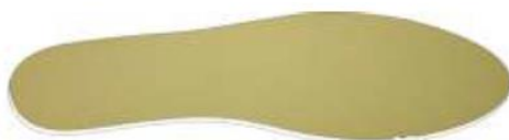
Palmita amortecedora (Foto Ilustrativa)

Palmita Amortecedora - Palmita de EVA de no mínimo 4,5 milímetros de espessura, dublada com sarja 100% algodão cru, com no mínimo 220 gramas por metro quadrado.