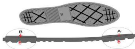
Vista do solado com desenho antiderrapante com o número gravado (Foto Ilustrativa)

espessura dianteira ( Espessura A ) 5 milímetros, e espessura traseira ( Espessura B ) 9 milímetros, tolerância admitida +/- 1 milímetro, isso deve ser seguido em todos os tamanhos