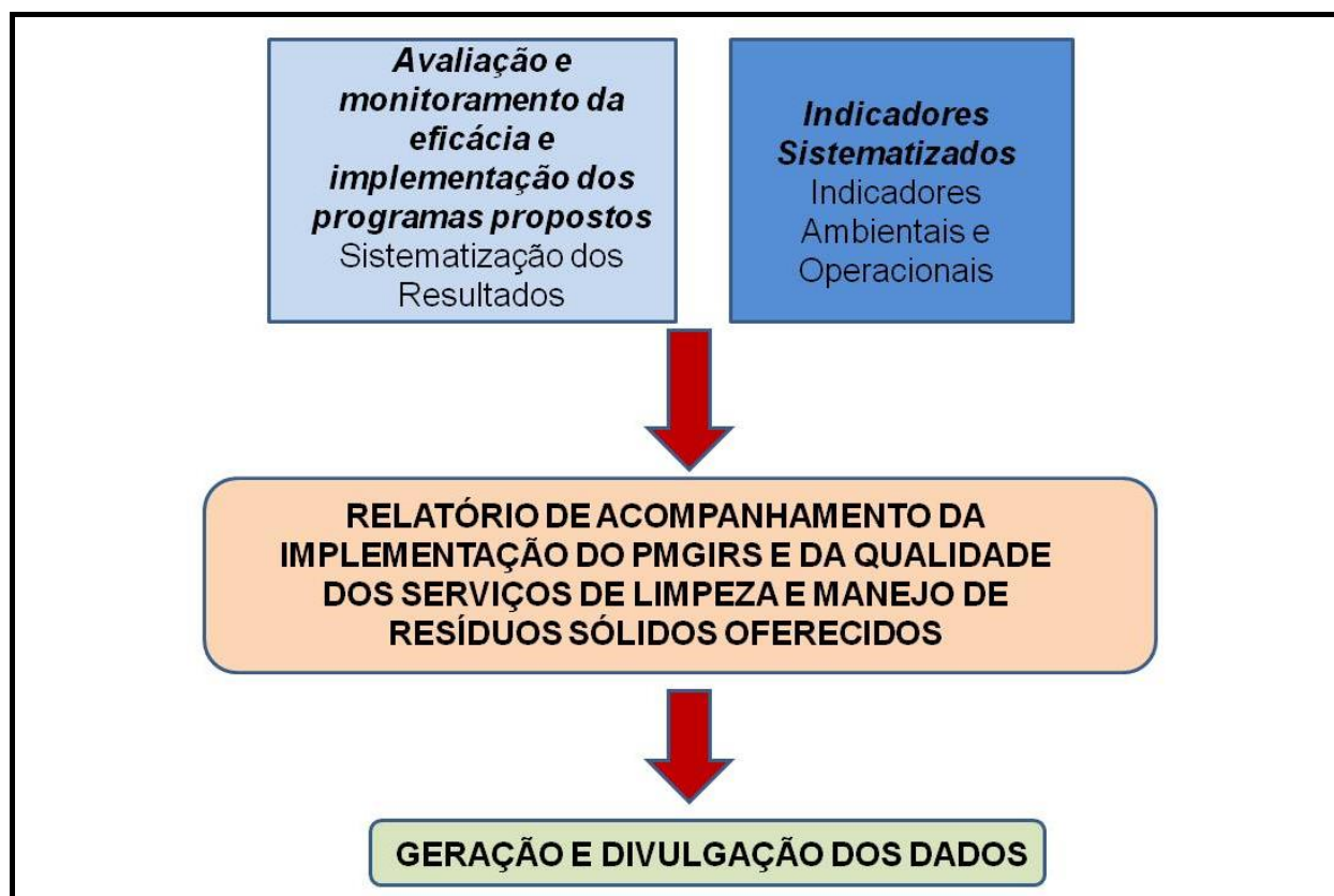
Figura 2 - Fluxograma de implementação do PMGIRS